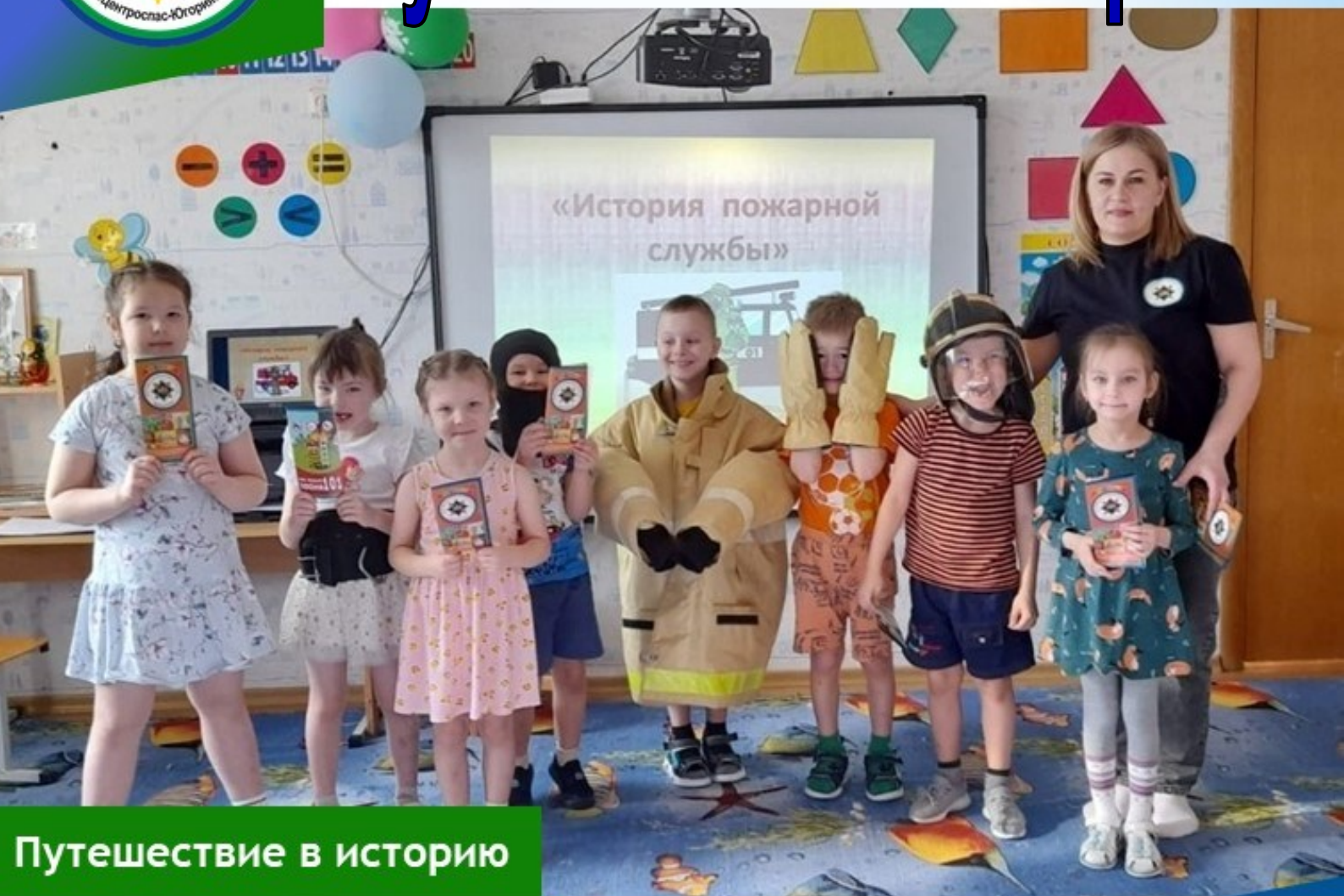
Путешествие в историю

В преддверии празднования 375 годовщины со Дня образования пожарной охраны России в МАДОУ детский сад «Олененок» инструктором противопожарной профилактики пожарной части с. Саранпауль филиала КУ «Центроспас-Югория» по Березовскому району проведено познавательное мероприятие для детей подготовительной группы «Одуванчики» на тему: «История создания пожарной охраны».